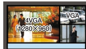
4VGAを1画面、VGAを2画面表示